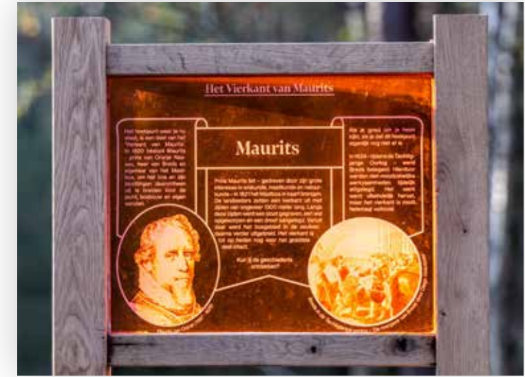
Een van de in november 2022 onthulde Belvédères van kunstenaressen Evelien van der Peijl.